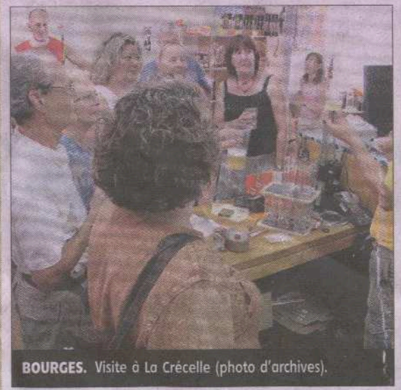
BOURGES. Visite à La Crécelle (photo d'archives).