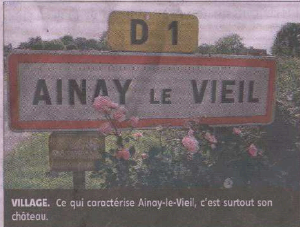
VILLAGE. Ce qui caractérise Ainay-le-Vieil, c'est surtout son château.

Ainay-le-Vieil c'est d'abord son château, celui du département qui a le mieux conservé son aspect féodal et son caractère défensif.